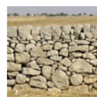
Recupero dei muretti a secco