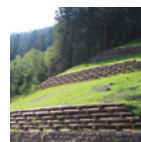
Operatore in Ingegneria naturalistica