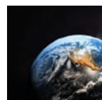
Corso GIS Base