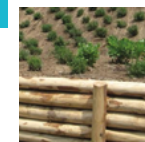
Progettare con i principi dell'Ingegneria naturalistica