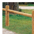
Die Kastanie für das Gebiet von den Wanderwegen zur Landschaft Modul Holz