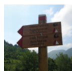
Die Kastanie für das Gebiet von den Wanderwegen zur Landschaft Modul Forst